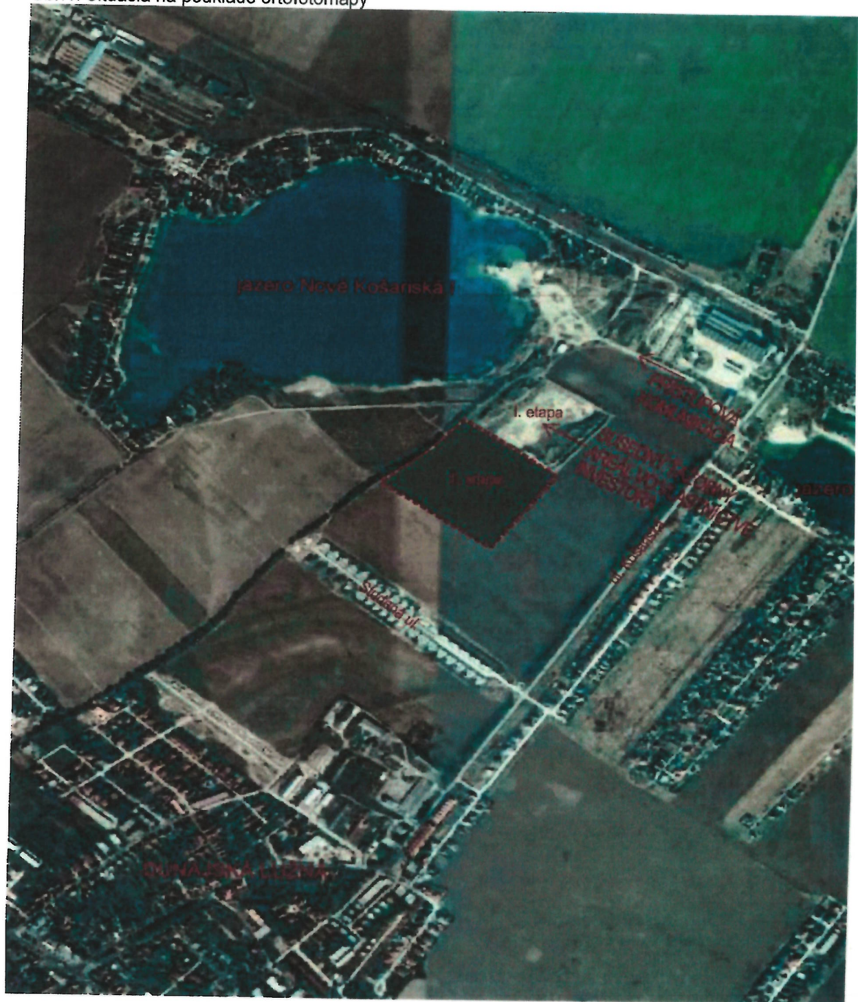
Obr.1: Situácia na podklade ortofotomapy