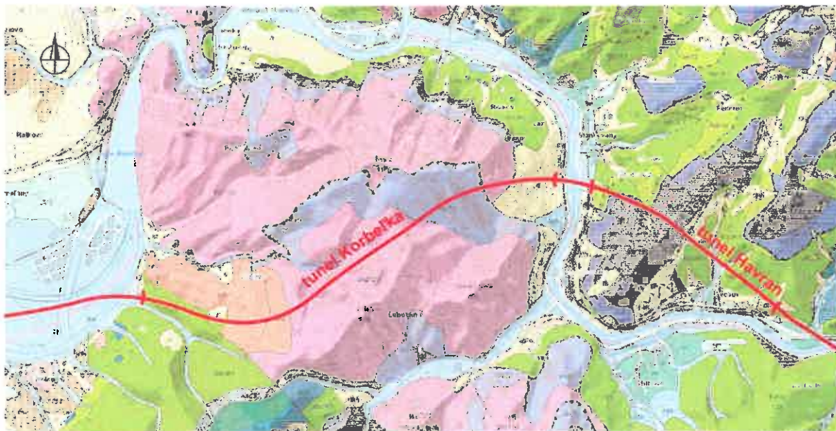
Geologická mapa predmetného územia (Geologická mapa Slovenska M 1:50 000 [online]. Bratislava: Štátny geologický ústav Dionýza Štúra, 2013: http://apl.geology.sk/gm50js ).

Situácia trasy tunelového variantu diaľnice (vo variante V2) je na obrázku č.2.