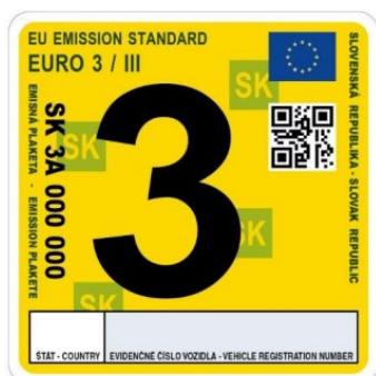
Emisná plaketa pre emisnú triedu EURO 3/III

Spôsob vydávania emisných plaket ustanovuje Vyhláška Ministerstva dopravy a výstavby Slovenskej republiky č. 138/2018 Z. z., ktorou sa ustanovujú podrobnosti v oblasti emisnej kontroly v znení neskorších predpisov (ďalej len „vyhláška č. 138/2018 Z. z.“). V prílohe č. 2 uvedenej vyhlášky sú vzory a požiadavky emisných plaket.