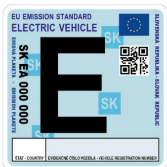
Emisná plaketa pre vozidlo s elektrickým pohonom