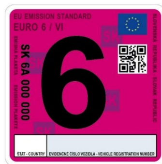
Emisná plaketa pre emisnú triedu EURO 6/VI