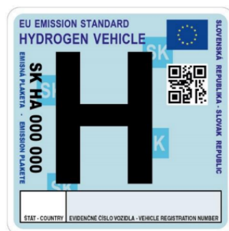
Emisná plaketa pre vozidlo s vodíkovým pohonom

Podrobnosti, týkajúce sa predaja emisných plakiet určuje § 10 vyhlášky č. 138/2018 Z. z. Predaj bude zabezpečovať technická služba emisnej kontroly spoločnosť S-EKA, spol. s r.o. Doklady potrebné k získaniu emisnej plakety určuje § 10 ods. 3 vyhlášky č. 138/2018 Z. z.