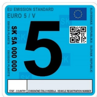
Emisná plaketa pre emisnú triedu EURO 5/V