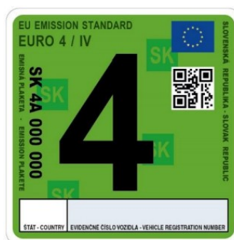
Emisná plaketa pre emisnú triedu EURO 4/IV